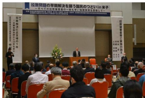
令和3年度「国民のつどい」

政府拉致問題対策本部と鳥取県等が主催し、県民の皆さんが拉致問題への関心を高め、日本政府や国際世論を後押しして拉致問題の早期全面解決が実現することを願って、毎年開催しています。拉致被害者のご家族の訴えや専門家による講演、映画上映などを行い、拉致問題解決へ向けた思いや願いを発信しています。