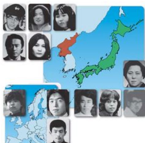
▲「必ず取り戻す!北朝鮮による日本人拉致問題」 (政府広報オンライン)