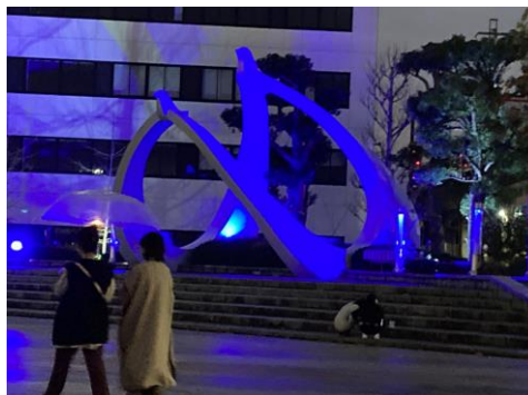
「ブルーリボン」ライトアップ

鳥取県では、「北朝鮮人権侵害問題啓発週間」の期間に合わせ、アニメ「めぐみ」の上映会や、拉致問題啓発パネル展の開催、「ブルーリボン」ライトアップなど、県内各所で啓発を行っています。